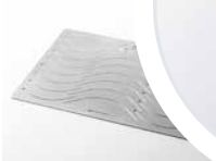
Halster för fisk i rostfritt stål