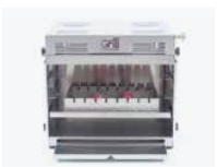
Ram för grillspett i rostfritt stål