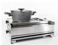
Spis i rostfritt stål