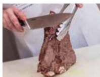
Korv- och grilllång