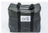
Grillväska i konstläder

Grillen är hopfällbar och med en praktisk väska är WeGrill lätt att transportera och är alltid tillgänglig. WeGrill erbjuder även t-shirts, kepsar, förkläden och personliga kockjackor.