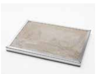
Pizzasten med ram i rostfritt stål